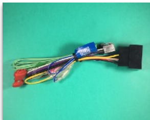
Connecteur principal ISO: HP, alimentation, ...