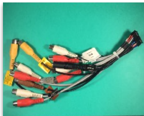
Connecteur entrées/sorties audio & vidéo