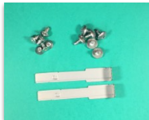
Vis de fixation & accessoires d'extraction