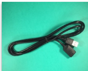
2 x rallonge USB