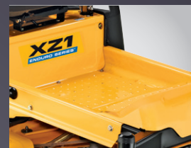
LARGE ESPACE POUR LES JAMBES