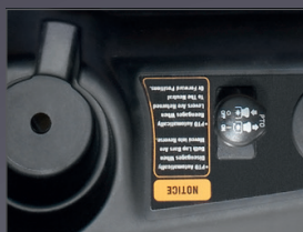
EMBRAYAGE ÉLECTRO MAGNÉTIQUE DES LAMES